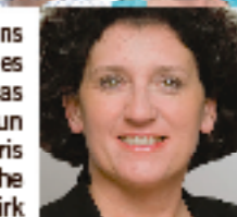
16 ANNEMIE TURTELBOOM