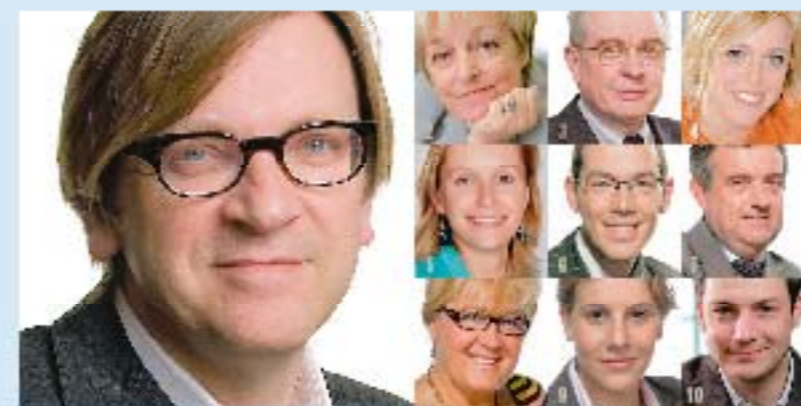
1 GUY VERHOFSTADT lijsttrekker