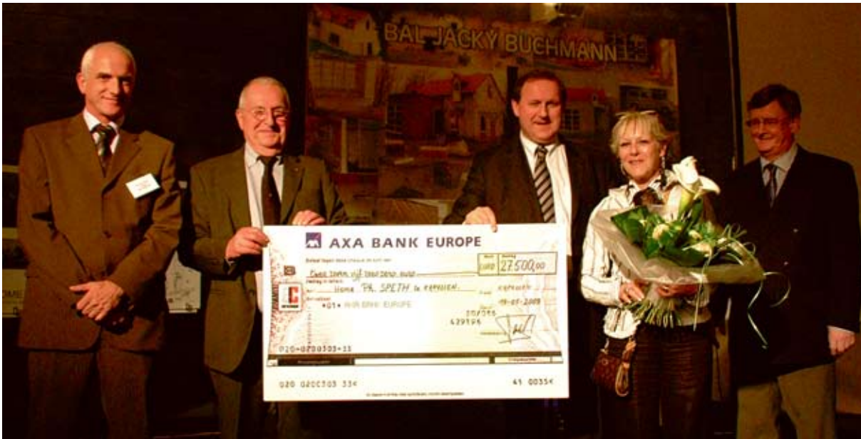
Met dit recordbedrag worden vijf nieuwe studio's gebouwd.