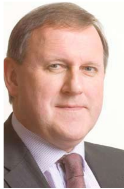
DIRK VAN MECHELEN | lijsttrekker

Vlaams viceminister-president Dirk Van Mechelen, tevens burgemeester van Kapellen , is met voorsprong de meest ervaren politicus in de Vlaamse regering. De dossierreiter is al tien jaar ononderbroken op post. In die periode maakte hij de ruimtelijke ordening heel wat humaner en transparanter. Hij schonk rechtszekerheid aan eigenaars van zonevremde constructies en weekendverblijven, en vereenvoudigde tal van procedures. Vandaag hoef je voor kleinere bouwwerken zoals zonnepanelen, een garagebox of een tuinhuisje geen vergunning meer aan te vragen. Met het aangepaste decreet dat op 1 september in voege treedt, breidde hij de lijst van vrijstellingen nog uit. Dirk Van Mechelen is eveneens de sterke kracht achter het orthodoxe begrotingsbeleid van Vlaanderen. "Ik wil de komende generaties besparen om alleen maar over 'besparen' te moeten praten", vindt Dirk. Daarom werkte hij de voorbije jaren hard om de Vlaamse schuld af te bouwen. Van 6,6 miljard tot nul eurocent. Vandaag is Vlaanderen volledig schuldenvrij.