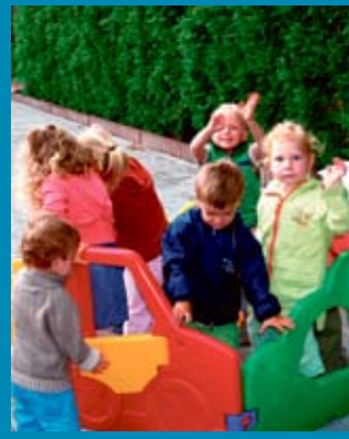
Tal van activiteiten bij de Buitenschoolse Kinderopvang.