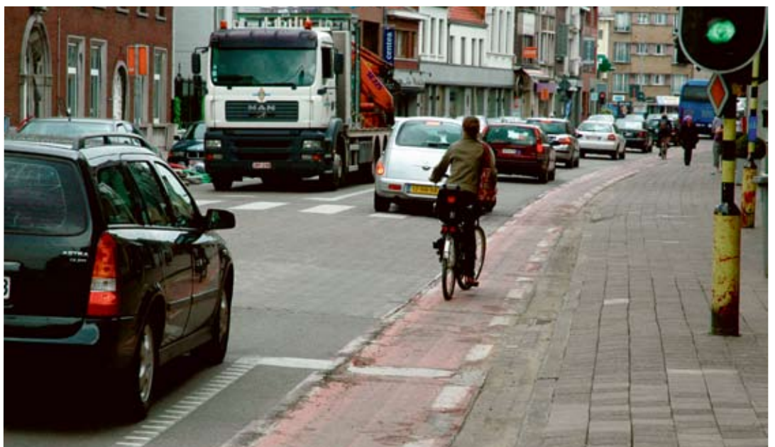
De vernieuwing van de Kapelse dorpskern staat volledig in het teken van de verkeersveiligheid.

De voorbije jaren investeerde Kapellen fors in de vernieuwing van haar dorpscentrum. Denk maar aan de ondertunneling van de Antwerpsesteenweg, de aanleg van het Dorpsplein, de Kerkstraat met parking,... In nauwe samenwerking met het Vlaams gewest zet het gemeentebestuur nog dit jaar de inspanningen onverdroten verder.