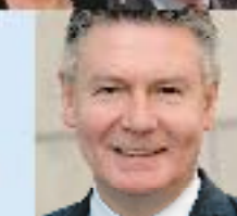
8 KAREL DE GUCHT

2 Gwendolyn Rutten 3 Sas van Rouveroij 4 Carmen Willems 5 Marleen Renders 6 Annemie Turtelboom 7 Vincent Van Quickenborne