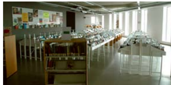
De Kapelse bibliotheek legt haar bezoekers extra in de watten.

Net zoals vorig jaar wil de Kapelse bibliotheek haar bezoekers in de zomer extra in de watten leggen. Van 1 juni tot en met 30 september kan elke lener tien boeken, vijf strips en vijf tijdschriften uitleenen voor een periode van vier weken.