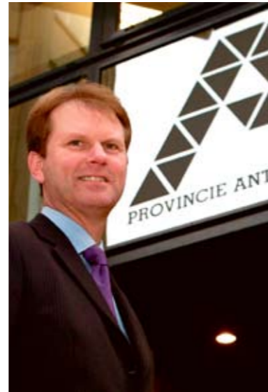
Gedeputeerde Koen Helsens: "Een gericht detailhandelsbeleid uitstippelen."

Kapellen 454 winkels zijn, waarvan 14 bakkers en 6 slaggers. Met het tweede bestand kan je eigen winkelgebieden vergelijken met die van andere gemeenten in de provincie. Aan de hand van 7.000 enquêtes kan je van elke gemeente een nauwkeurige profielschets opmaken. "Ook voor Kapellen zal dit uiteraard een belangrijk instrument zijn om een gericht detailhandelsbeleid uit te stippelen met inachtnaam van bijzondere aandachtspunten", zegt gedeputeerde voor economie Koen Helsens.