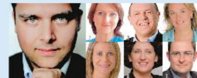
1 PHILIPPE DE BACKER eerste opvolger

2 Gwendolyn Rutten 3 Sas van Rouveroij 4 Carmen Willems 5 Marleen Renders 6 Annemie Turtelboom 7 Vincent Van Quickenborne