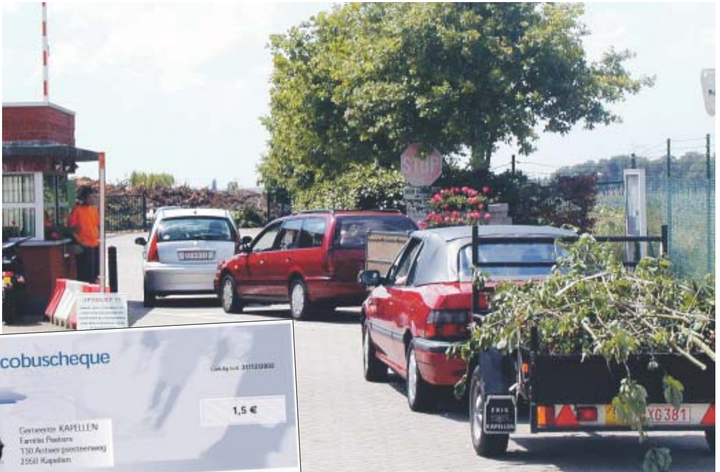
Als het van de VLD afhangt, kunnen de inwoners van Kapellen vanaf volgend jaar met hun Jacobuscheques ook op het gemeentelijk containerpark terecht.

Elke Kapelse burger ontvangt nu jaarlijks zeven cheques ter waarde van 1,5 euro. Door middel van de Jacobuscheque wordt de inwoners de mogelijkheid gegeven om gratis van bepaalde gemeentelijke diensten gebruik te maken. Zo kan hij of zij met de Jacobuscheque gratis een toneelvoorstelling van de Cultuurdienst bijwonen, zwemlessen nemen, gaan schaatsen, enz. Het is immers de bedoeling om de Kapellenaar te stimule-