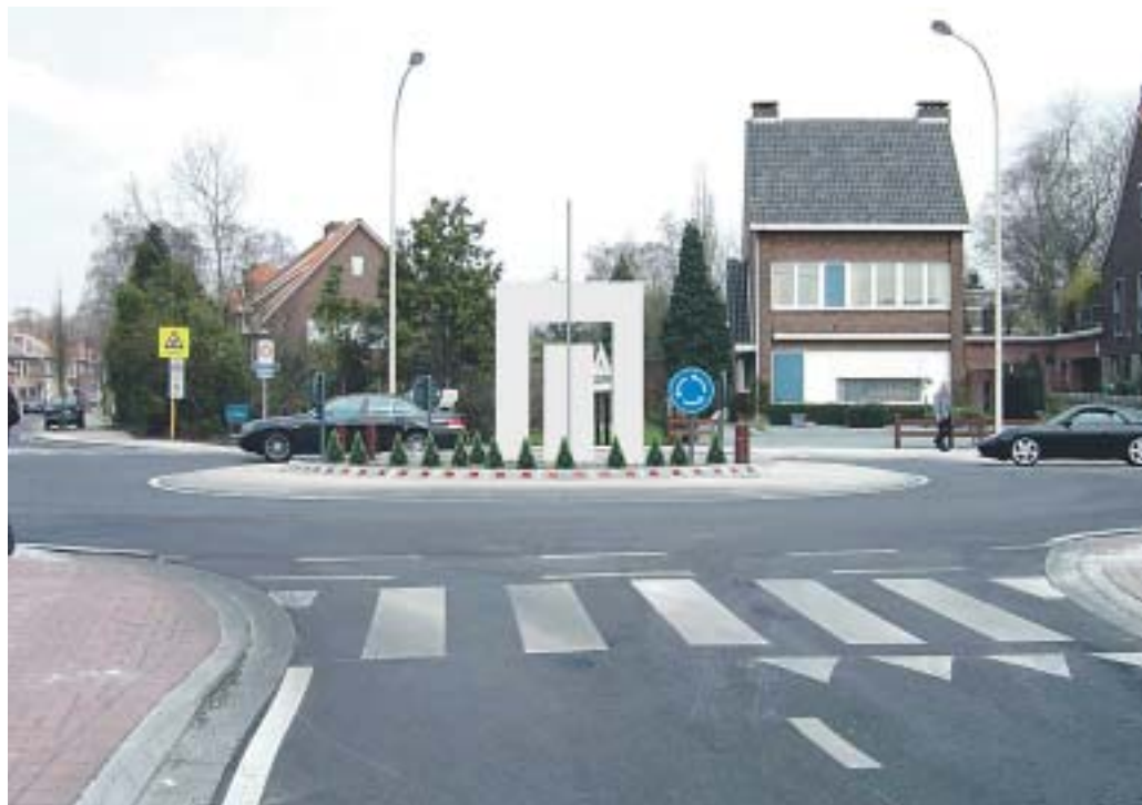
Op de rotonde ter hoogte van het Klein Heiken en de Oude Bergsebaan komt een fraai kunstwerk, als symbolische poort van Kapellen. Hier alvast een toekomstige impressie.