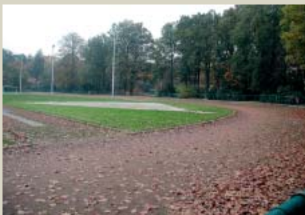
De atletiekpiste in het gemeentepark wordt volledig uitgevoerd in kunststof.

den voorgelegd, zodat in januari 2005 met de aanbesteding kan begonnen worden. De werken omvatten de volledige renovatie aan de gehele atletiekinfrastructuur, waarbij de atletiekpiste en aanliggende zones geheel in kunststof worden aangelegd. De 100-meterbaan wordt uitgebreid tot 8 banen, een nieuwe polsstokspringzone wordt gecreëerd en de zones voor de overige kampnummers worden hertekend. Tevens zal een aantal technische bijhorigheden, zoals de kooi voor hamerslingers en valmat voor hoogspringen, worden vervangen.