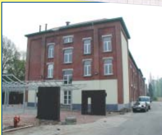
Blok J in Hoogboom: de leerlingen van de gemeentelijke lagere school 'De Platanen' zullen vanaf 2 juni de lessen volgen in dit volledig gerenoveerd schoolgebouw. Op 14 juni is er de officiële opening.