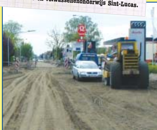
De Antwerpsesteenweg ondergaat een complete gedaanteverandering: een nieuwe wegbedekking, veilige in- en opstapplaatsen voor bussen, een afgescheiden fietspad en een rotonde ter hoogte van de Oude Bergsebaan.