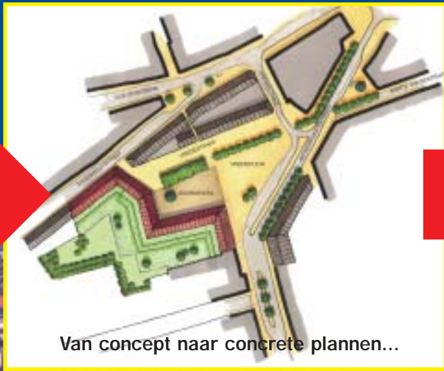
Van concept naar concrete plannen...