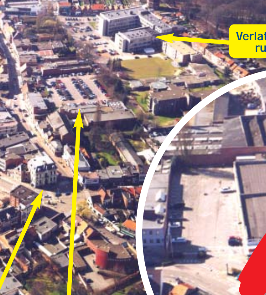
Verlaten SINT-JOZEFZIEKENHUIS campus: ruimte voor nieuwe bejaardenflats!