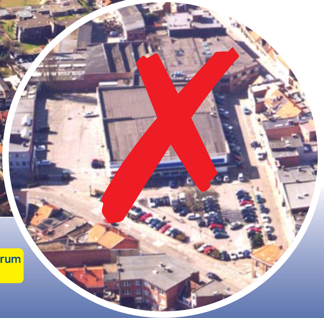
Parking en dienstencentrum 'T BRUGGESKE