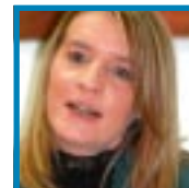
An Stokmans OCMW-voorzitter