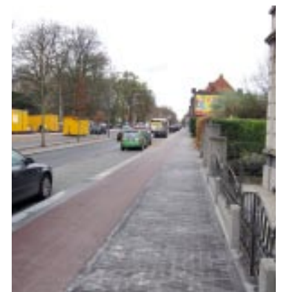
Eén doorlopend fietspad.

Onder meer door de realisatie van de tunnel heeft Open Vld er stap voor stap voor gezorgd dat de zwakke weggebruiker veilig door onze gemeente kan rijden. Dat brengt met zich mee dat hier soms