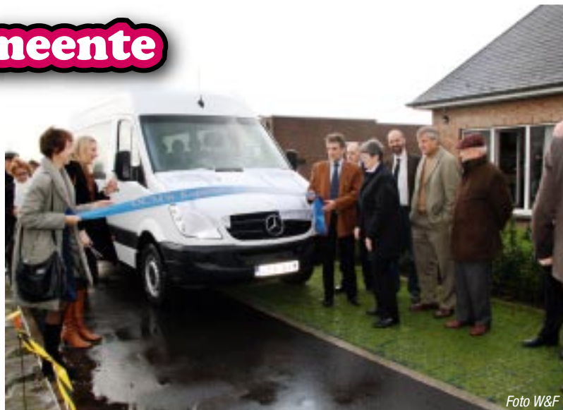
Met de handicar houden we andersvaliden uit hun isolement.

Begin november werd de gloednieuwe handicar van het OCMW van Kapellen en het OCMW van buurgemeente Stabroek plechtig in gebruik genomen.