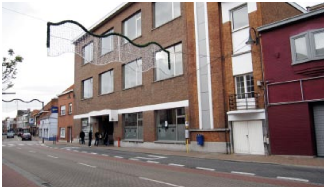
Het gemeentebestuur wil een nieuw Administratief Centrum bouwen in de Hoevensebaan, pal in het centrum van onze gemeente.

Open Vld wil een nieuw Administratief Centrum bouwen in de Hoevensebaan op de plaats waar momenteel de huidige Academie voor Muziek en Woord gehuisvest is. Momenteel lopen onderhandelingen om het hoekpand naast de inrit van 't Bruggeske te kunnen verwerven. Na afbraak ervan, samen met de oude gebouwen waar destijds nog de gemeenteschool in ondergebracht was, komt op deze ruimte met een gevelbreedte van ongeveer 40 meter vrij om een volledig nieuw AC te bouwen. Meteen zullen ook de diensten van het OCMW in dit nieuwe gebouw onderdak krijgen.