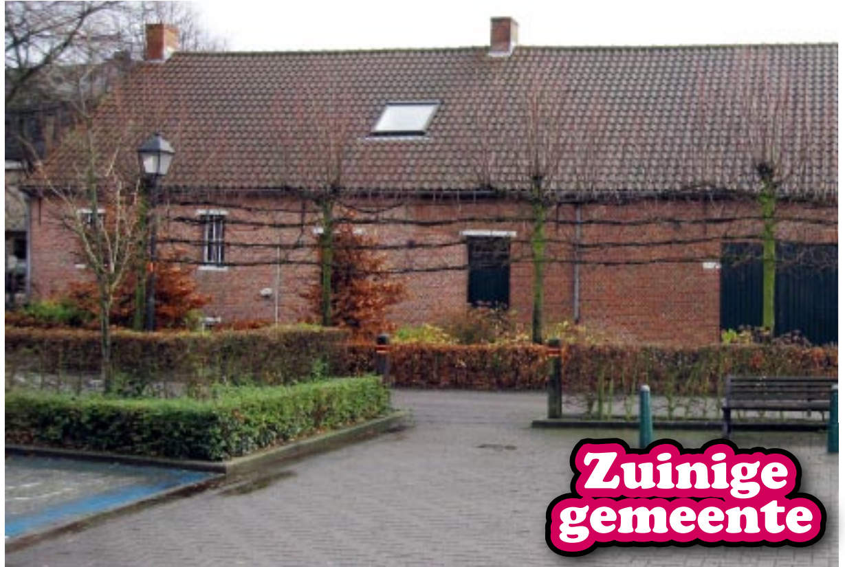
Een pak gebouwen staan op de investeringsagenda.

Uiteraard is hier dagelijks veel politieke moed voor nodig en wordt elke euro tweemaal omgedraaid alvorens hij wordt uitgegeven. Gewoon goed huisvaderschap heet dat. De grafieken maken een vergelijking met de ons omliggende gemeenten, maar ook met Vlaan-