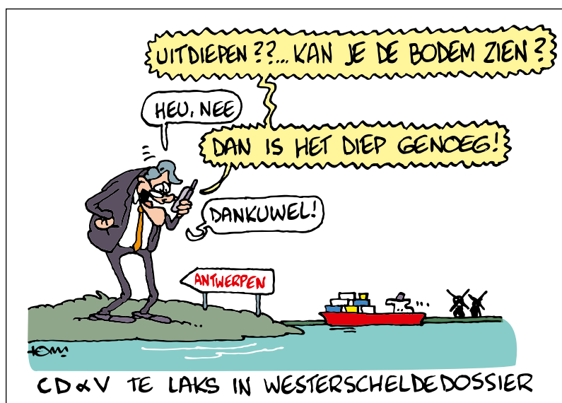
CD & V TE LAKS IN WESTERSCHELDE DOSSIER

Ook de eerste dansnamiddag die het cultuurcentrum in samenwerking met het OCMW van Kapellen organiseerde, was een schot in de roos. Niet alleen de vaste bezoekers van het dienstencentrum waren op 17 november van de partij. 't Bruggeske was immers bijna te klein voor de meer dan 300 dansende senioren. Wil je er graag bij zijn op de volgende dansnamiddag? Schrijf dan alvast in je agenda dat op 8 februari de volgende editie plaatsvindt. Dan kunnen de senioren opnieuw de beentjes losgooien. DJ Lady Angelina draait plaatjes en Les Amis de Louis zullen een concert geven in 't Bruggeske.