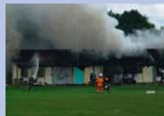
Zware brand vernielt lokalen Chiro Jez.

Chiro Jez werd op 22 juni 2009 getroffen door een zware brand. De lokalen en heel wat materiaal werden volledig vernield. Het gemeentebestuur organiseerde daarom onmiddellijk een solidariteitsactie om sport-, spel- en kampmateriaal te verzamelen. Ook Chiro Jez zelf verzamelde tal van fondsen voor de financiering van een nieuwbouw. Ze komen echter nog middelen tekort. Daarom kende het gemeentebestuur hen een bouwsubsidie toe van 50.000 euro met de voorwaarde dat de gemeentelijke jeugddienst in de zomer de nieuwe lokalen mag gebruiken voor haar activiteiten, zoals ondermeer de speelpleinwerking.