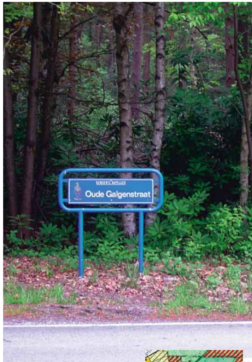
Open Vld wil het Klinkaardbos maximaal vrijwaren.