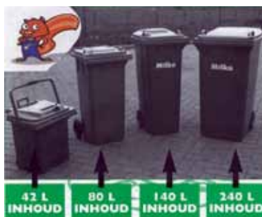
Sorteren is de boodschap.

In 2008 heeft de gemeente Kapellen een samenwerkingsovereenkomst 2008-2013 afgesloten met het Vlaams Gewest. Van groot belang hierbij is de communicatie naar de bevolking. Hiervoor gebruikt het gemeentebestuur verschillende kanalen zoals kranten, de gemeentelijke website, Info Kapellen en thema-folders over milieu.