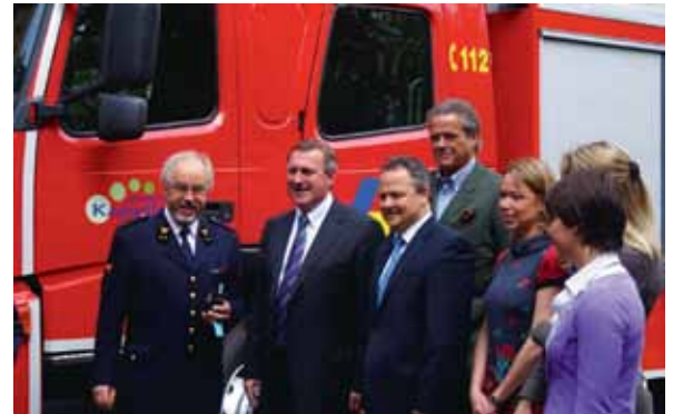
Inhuldiging van de nieuwe commandowagen.

Gemiddeld wordt jaarlijks 640.000 euro aan werkings- en personeelsmiddelen vrijgemaakt, gekoppeld aan een investeringsenveloppe voor materiaal en voertui-