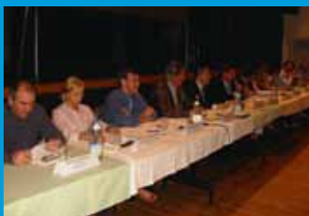
Wijkvergaderingen goed bijgewoond.

Wijkvergaderingen geven het gemeentebestuur de mogelijkheid de burgers rechtstreeks te informeren en hen de kans te geven vragen te stellen over alles van gemeentelijk belang. Zo weet het bestuur meteen wat er onder de mensen leeft en wat er kan bijgesteld worden. In de loop van de maand april werden dan ook in Putte, Hoogboom-Zilverenhoek, Kapellen-centrum en Kapellenbos hoorzittingen georganiseerd, die massaal door de Kapellenaren werden bijgewoond!