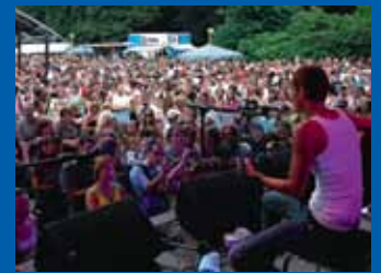
Pulptuur barst los op 27 juni.