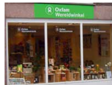
De nieuwe wereldwinkel op de Hoevensebaan.

In de nieuwe winkel kan je een waaier aan voedingsproducten krijgen, maar ook het aanbod aan handwerkproducten en cadeau-artikelen vergrootte. De winkel heeft