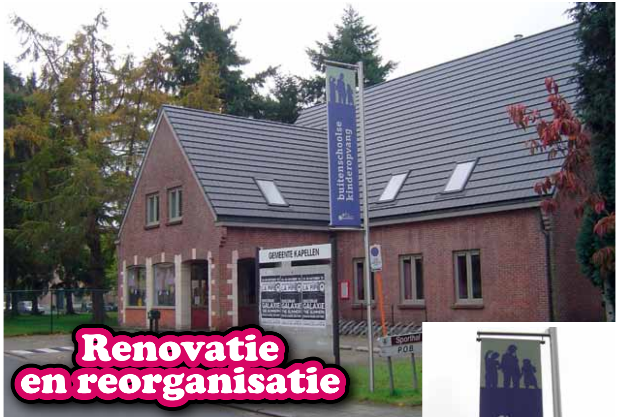
De vernieuwde locatie in Hoogboom.

Het jeugdatelier biedt plaats aan 20 kinderen. Jongeren van 6 tot 18 jaar leren hier knutselen, tekenen en schilderen. Ze maken er maskers, dieren, poppen, schilderijen, kijkdozen... Kortom, alles om creatief bezig te zijn. Het is geopend op woensdag van 13.30u tot 16u,