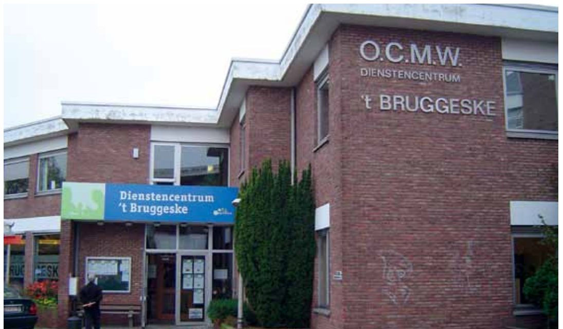
Dienstencentrum 't Bruggeske.

Het sociaal beleid in Kapellen werd vertaald in het lokaal sociaal beleidsplan, dat werd goedgekeurd door de gemeente- en OCMW-raad van februari 2008. Dit beleidsplan brengt een concreet verhaal, met concrete doelstellingen, concrete verantwoordelijkheden, concrete inzet van mensen en middelen. Tijd om een eerste evaluatie te maken van het plan. Op de raadscommissie van 13 september 2010 werden de verschillende thema's, doelstellingen en acties uitvoerig besproken, geëvalueerd en meer dan positief onthaald.