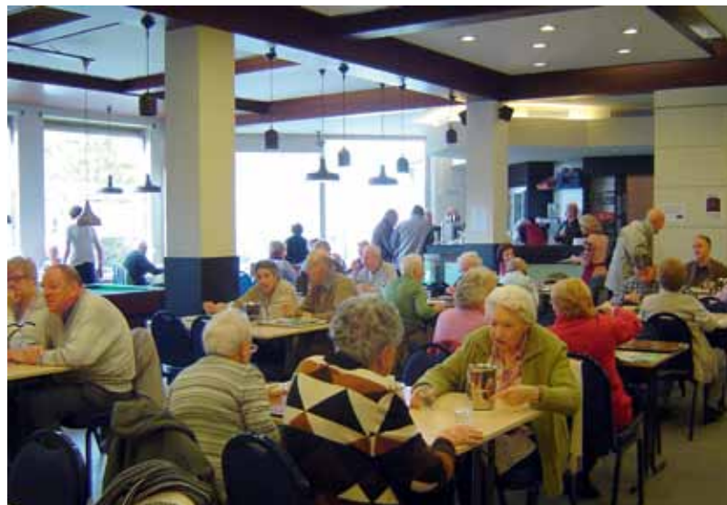
Het OCMW wil mensen uit hun isolement halen.

Naar preventie- en sensibiliseringsbeleid wordt Ergo woonadvies aangeboden, naast de verschillende