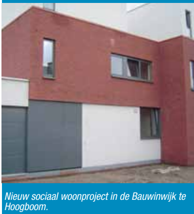
Nieuw sociaal woonproject in de Bauwinwijk te Hoogboom.

Ook private sociale projecten worden door de gemeente ondersteund.