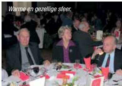
Warme en gezellige sfeer.

Behalve voor uw gezondheid zijn er meer redenen om te gaan bewegen. Ook gezelligheid, plezier en ontmoeting spelen een belangrijke rol. Op verschillende manieren trachten we hierop in te spelen!