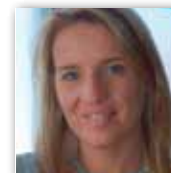
An Stokmans OCMW-voorzitter