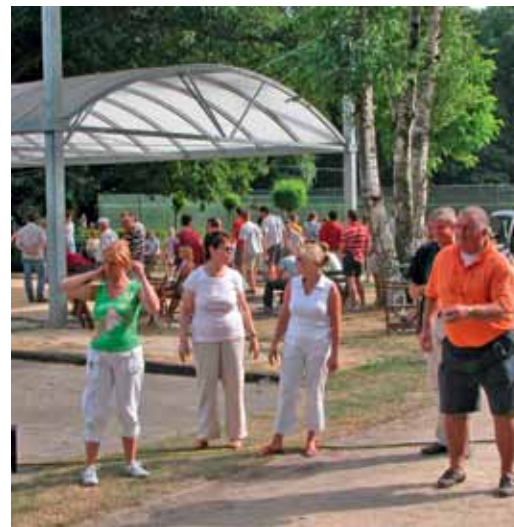
Jaarlijks petanquetornooi van Jong Vld Kapellen.

Jong Vld Kapellen organiseert ook regelmatig niet-politieke activiteiten. Zo vond er op 19 juni in het park van Kapellen weer een geslaagd petanquetornooi plaats met meer dan 100 deelne-