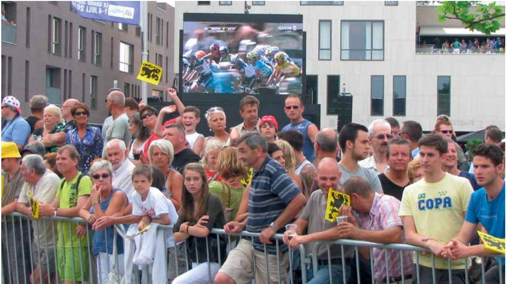
Evenementen in overvloed deze zomer in Kapellen!