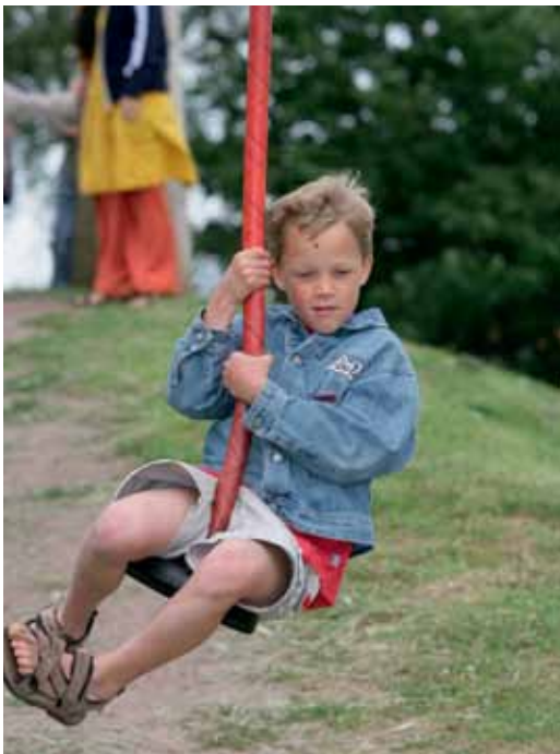
Buiten spelen betekent bewegen.

Wat is er leuker dan op een zonnige dag je picknickmand te vullen met lekkers en gezellig met de kinderen naar één van onze speeltuinen te trekken. Dagelijks, voornamelijk in de vakantieperiodes, zien we ouders met hun kinderen genieten