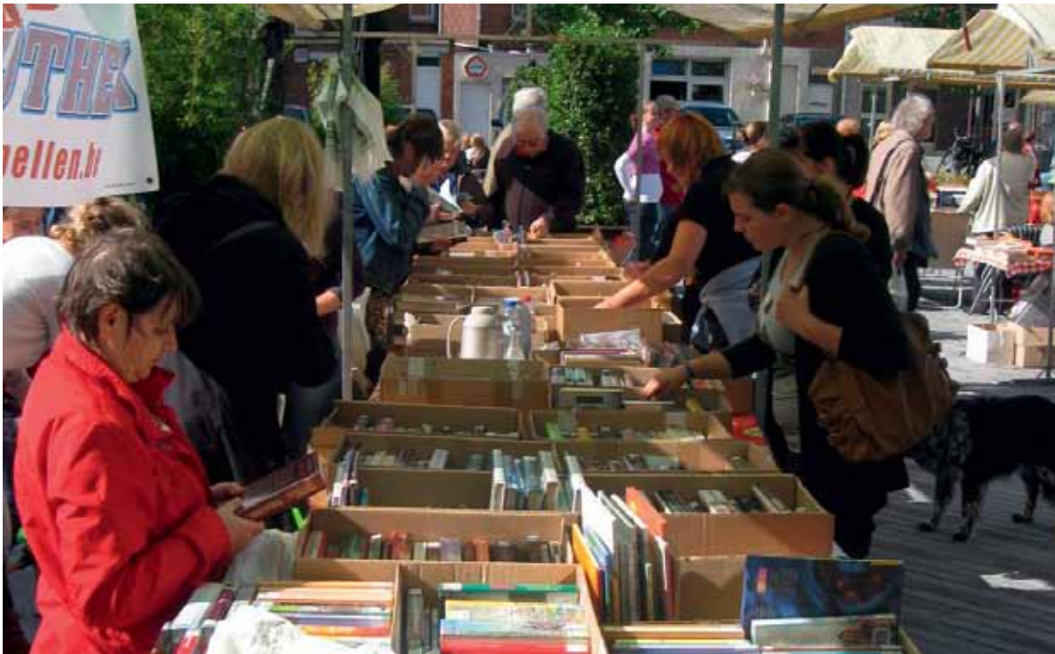
Boekenmarkt op het Dorpsplein.