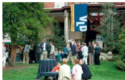
BBQ Open Vld Kapellen op 17 september: een waar smulfeestijn!

Deelnameprijs aan de Open Vld BBQ bedraagt 25,00 euro. Inschrijven tot 14 september via liberaalcentrum@skynet.be of 03/664.78.28.